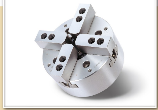
寸法図 > Dimensions