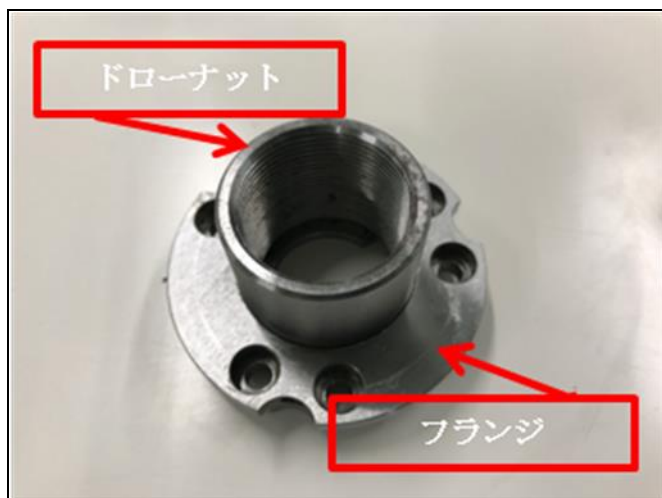
【写真3：ドローナットとフランジ（上面）】