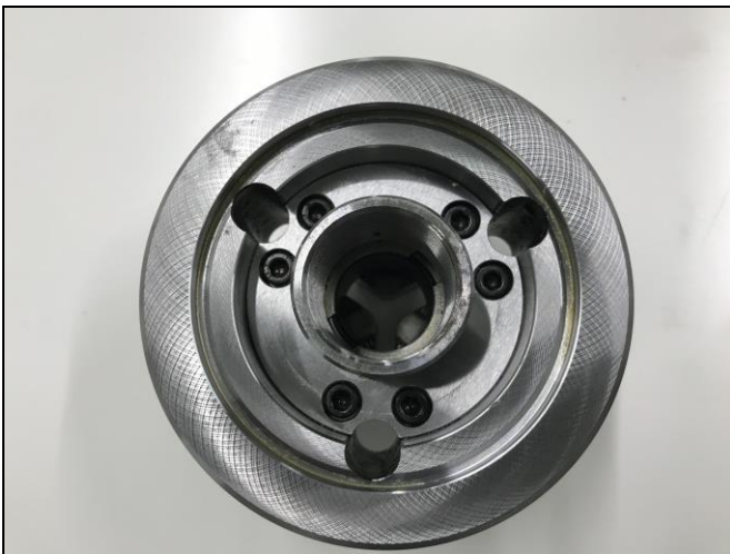
【写真8：チャック本体とドローナット+フランジ（組み込み後）】

6. ③のアーサーノーズ用バックプレートが必要で有ればチャック本体に付けて下さい。