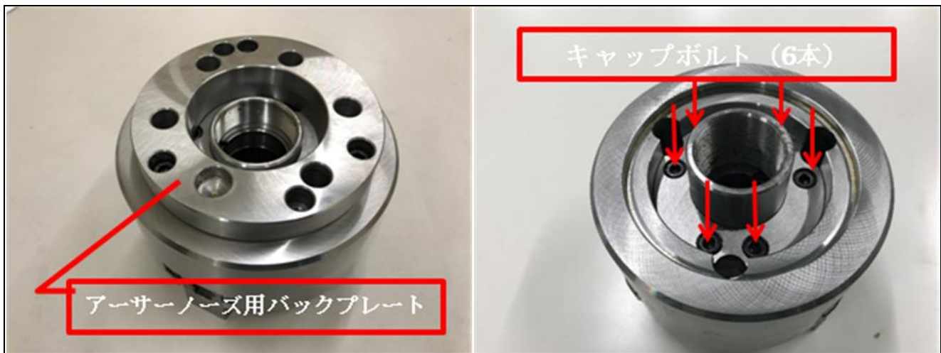
【写真1：チャック裏側】

1. ③のアーサーノーズ用バックプレートを取付けている3本のキャップボルトを緩めて、バックプレートを外して下さい。