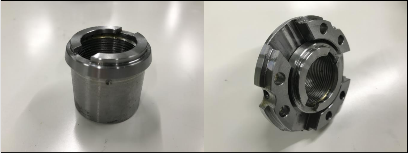
【写真6：ドローナット本体】