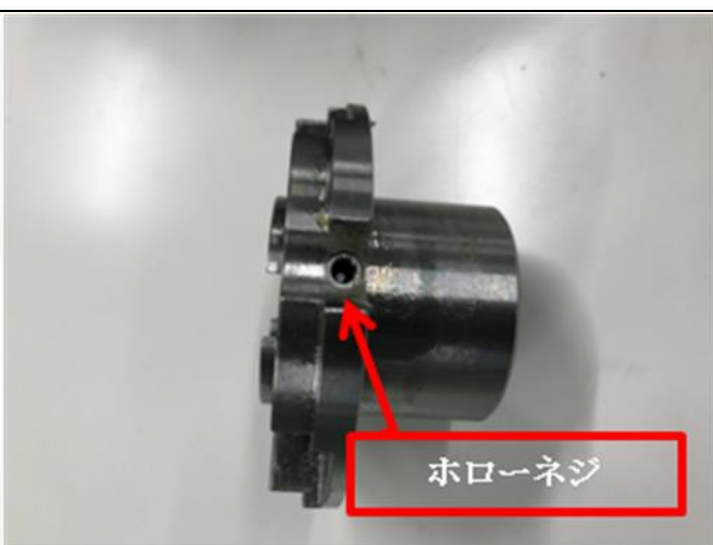
【写真4：ドローナットとフランジ（側面）】